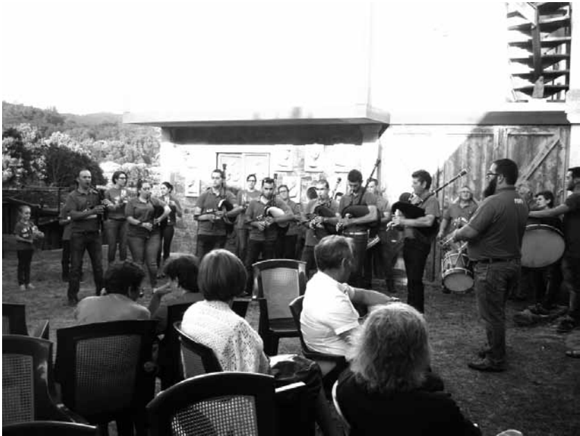
O grupo de gaitas “Vainela Salgueiros” no concerto homenaxe a Valenzuela