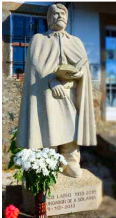
Monumento a Paco Lareo na Fundación